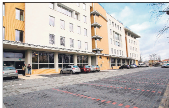
Na darmowym parkingu przylegającym do budynku stało niewiele samochodów. Brakowało informacji, że parking jest ogólnie dostępny.