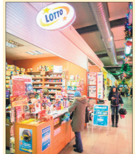
Warta prawie 16 mln zł wygrana w Lotto padła w tym małym sklepiku w centrum handlowym Czerwony Rynek.

71 tys. 608 zł wygrał w sobotnim losowaniu Mini Lotto gracz, który puścił los w kolekturze u zbiegu ulic Traktorowej i Aleksandrowskiej. Jego wygrana byłaby dwa razy większa, gdyby nie fakt, że musi podzielić się z nią z graczem z Rudy Śląskiej, który kupił kupon z identyczną „piątką”. (IZJ)