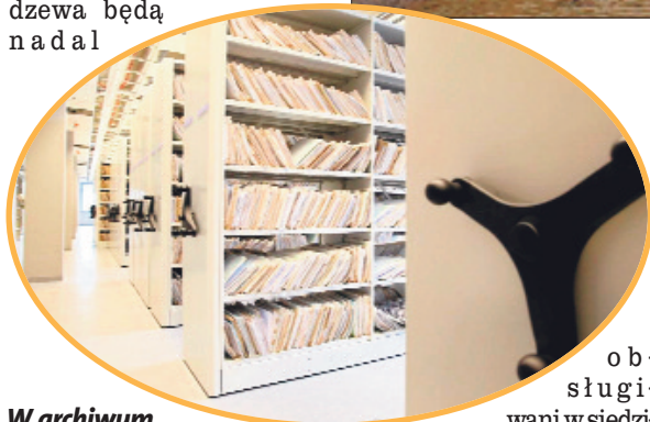
W archiwum znajdują się aż 4 kilometry akt ubezpieczeniowych.

mieszkańców Bałut, B - przeznaczone dla pracowników oraz C dla osób udających się do jednego z 26 gabinetów lekarzy orzeczników oraz na komisje lekarskie obsługujące ubezpieczonych z całego województwa. Mieszkańcy Śródmieścia, Polesia i części Widzewa będą